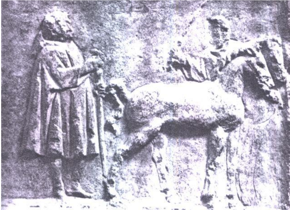
Knielange mantel met mouwen, maar wel met een capuchon. Deze werd veel gedragen.