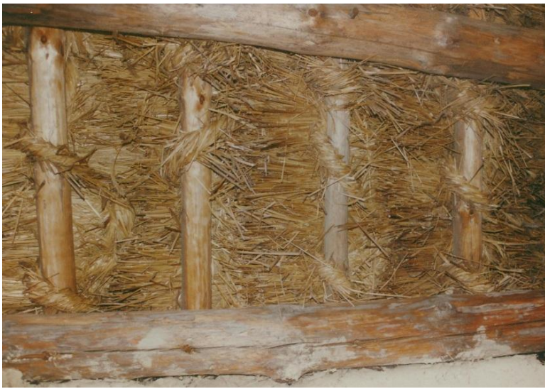
Ook in Spanje een opvulling met worstjes stro.