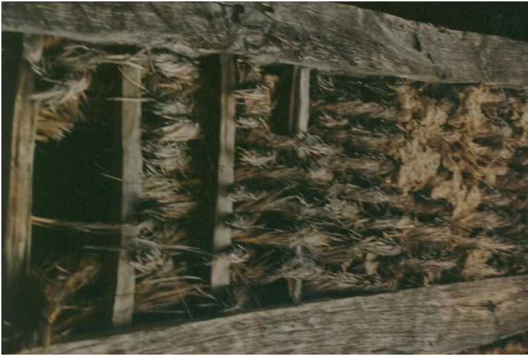
Zelfs nog vast gebonden met worstjes van stro