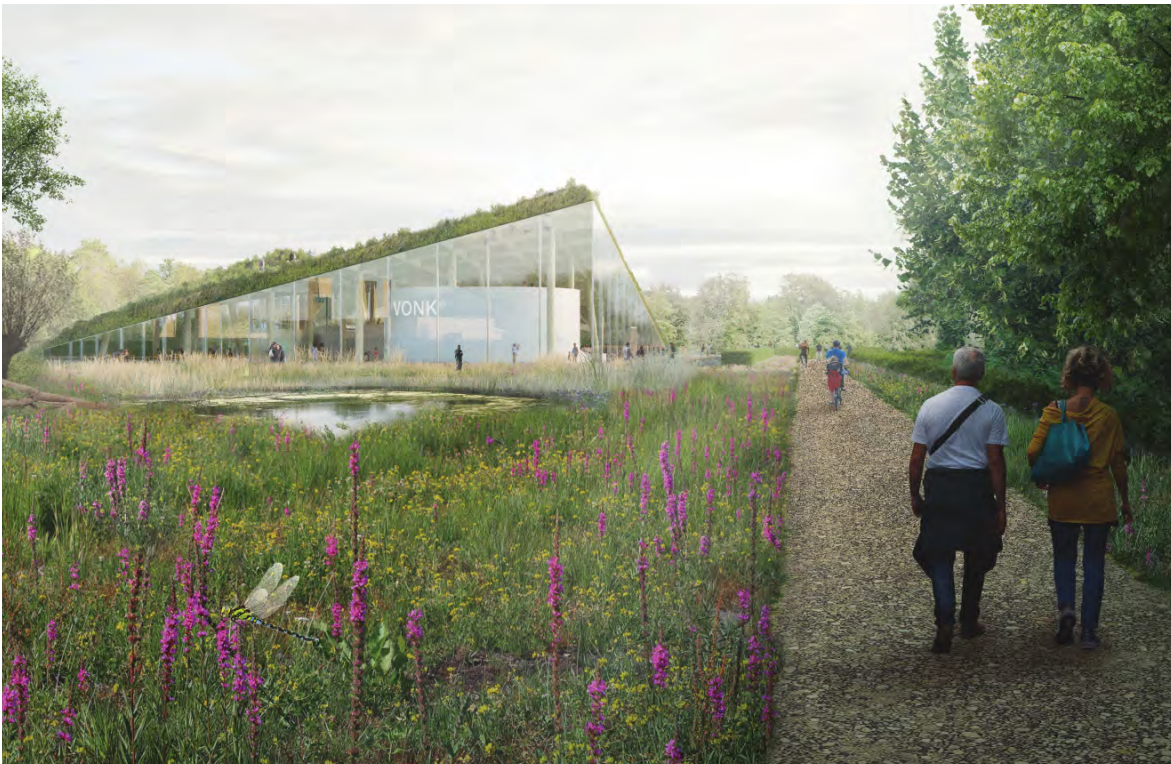
Studio Marco Vermeulen

Aan deze besluitvorming lag een intensief en lang traject van ruim twee jaar ten grondslag, waarbij we tientallen inspraaksessies en bijeenkomsten hebben georganiseerd. Veel betrokkenen hebben we kunnen overtuigen van onze plannen, maar een kleine groep ook niet. We hebben in onze planning rekening gehouden met proceduretijd bij de Raad van State, zonder dat de beoogde openingsdatum van Museumpark Vonk in april 2025 uitloopt.