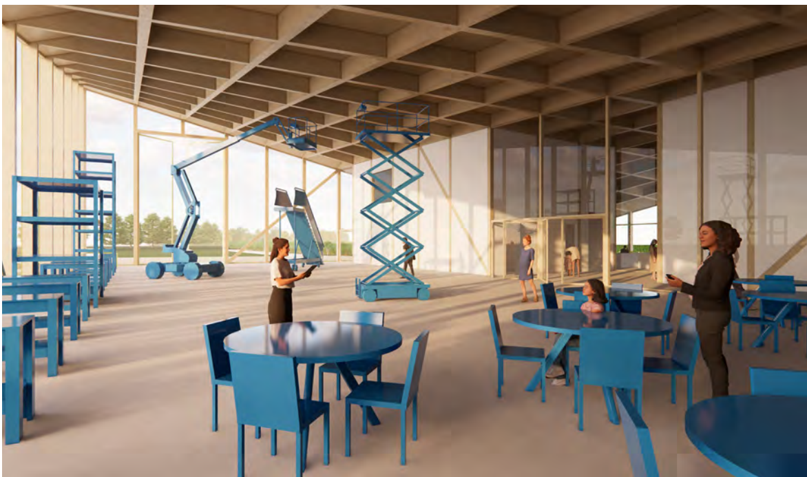
Studio Marco Vermeulen