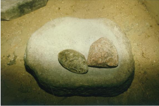
Hier kleine rolstenen als pletter

Later werden stenen in het vulkaanachtige Eifel-gebergte uitgekapt, (heel slim, want het daar aanwezige basalt-lava gesteente was en bleef veel ruwer) en per kano of kar versleept naar de Nederlanden. Het was daar een gewild ruilartikel, want het malen ging wel 10 keer zo snel. Ook door de draaisteen erop. Het gewicht van de draaisteen versnelde het malen ook.