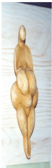
Deze venus van ivoor is gevonden in Lespugue(Frankrijk) en stamt ook uit 28.-22.000 v. Christus.