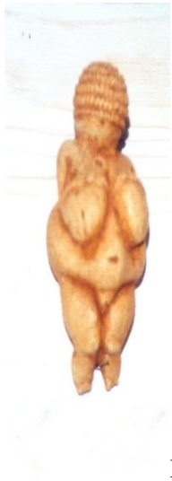
Deze vrouwenfiguur van kalksteen is gevonden in Willendorf (Oostenrijk) en stamt van ongeveer 28.000-22.000 voor Christus.