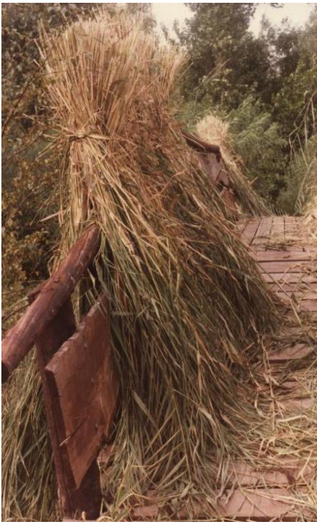
Even tijdelijke opslag